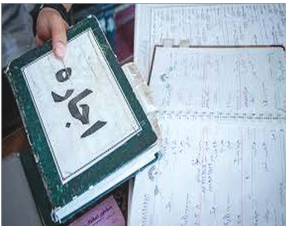
گروه بازارها هفته نامه نوسان

افزایش اجاره‌ها بار سنگینی است که بر دوش مستأجران اضافه می‌شود