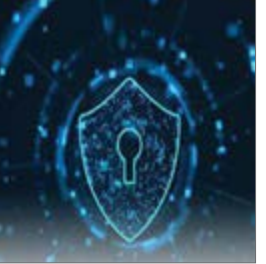
سیلاگراس / اواشنگتن بست

تخریب‌هایی که غرب علیه روسیه اعمال کرده و تندی‌هایی که برخی کشورها برای حفاظت از محصولات کشاورزی و مواد غذایی داخلی خود اتخاذ کرده‌اند، سه عامل جدید نگرانی و تهدیدی برای امنیت غذایی جهان است. نخستین مورد، اختلال در تولید است. جنگ در اوکراین، عرضه محصولات مهم کشاورزی را که از منطقه دریای سیاه صادر می‌شوند، کم کرده است. صادرات بسیاری از محصولات، از گندم و روغن گیاهی تا کود کاهش یافته است. بر اثر جنگ، کشت بهاره در اوکراین دچار اختلال شده است. کشاورزان اوکراینی تلاش می‌کنند به هر شکل فعالیت معمول خود را ادامه دهند؛ اما از میزان کاشت و برداشت محصولات کاسته خواهد شد. یکی از صادرکنندگان بزرگ مواد غذایی اوکراین مجبور شده است، غذای ارتش را تأمین کند.