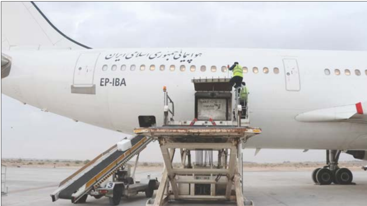
گروه صنعت گوازی

شیشه بران: در مقابل صادرات طلا از کشور، ارزش آفرینی نکرده ایم!