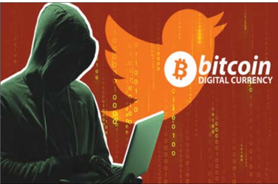
گروه بازارها کرونی

خلأ قانونی، عدم نظارت و آموزش‌های لازم منجر به کلاهبرداری‌های در حوزه ارز رمزها می‌شود