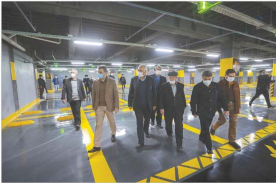
گروه شهری گزارش

نوروزی: سیاست عدالت فضایی شهرداری اتفاقات خوبی را در شهر رقم زده است