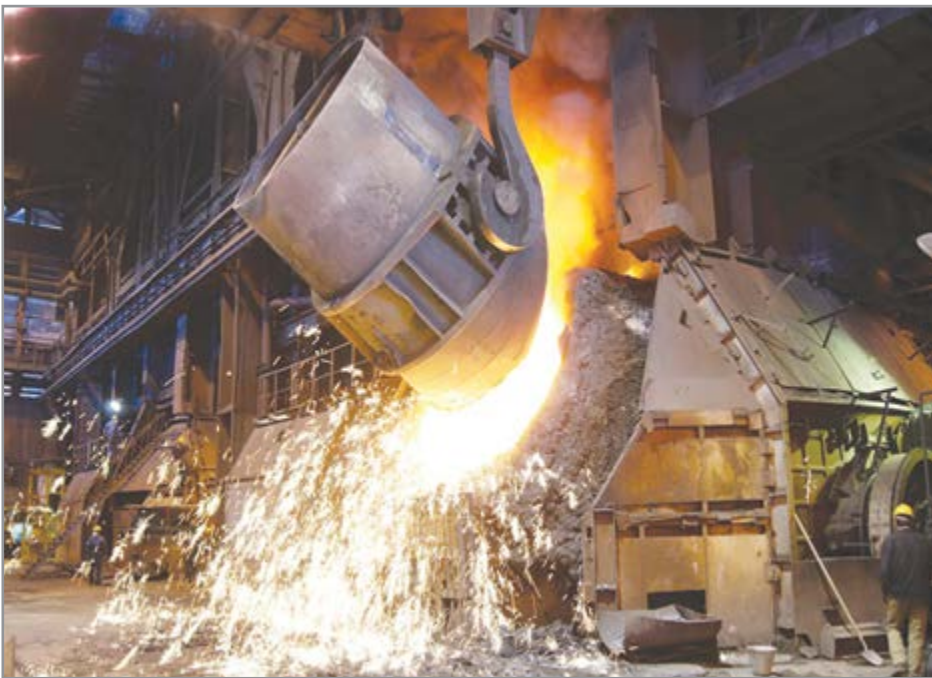
گروه صنعتی فولاد مبارکه

فولاد مبارکه از سال ۱۳۸۱ با شعار تأمین پایدار و اقتصادی اقلام مورد نیاز کارخانه، ۱۰۰ هزار قطعه را بومی‌سازی کرده است