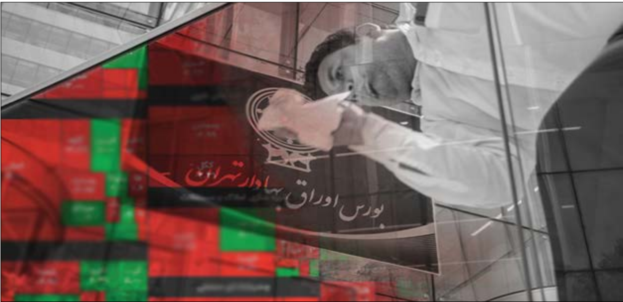
گروه بازرها کوزلی

در بورس‌های دیگر کشورها صف خرید و صف فروش نداریم