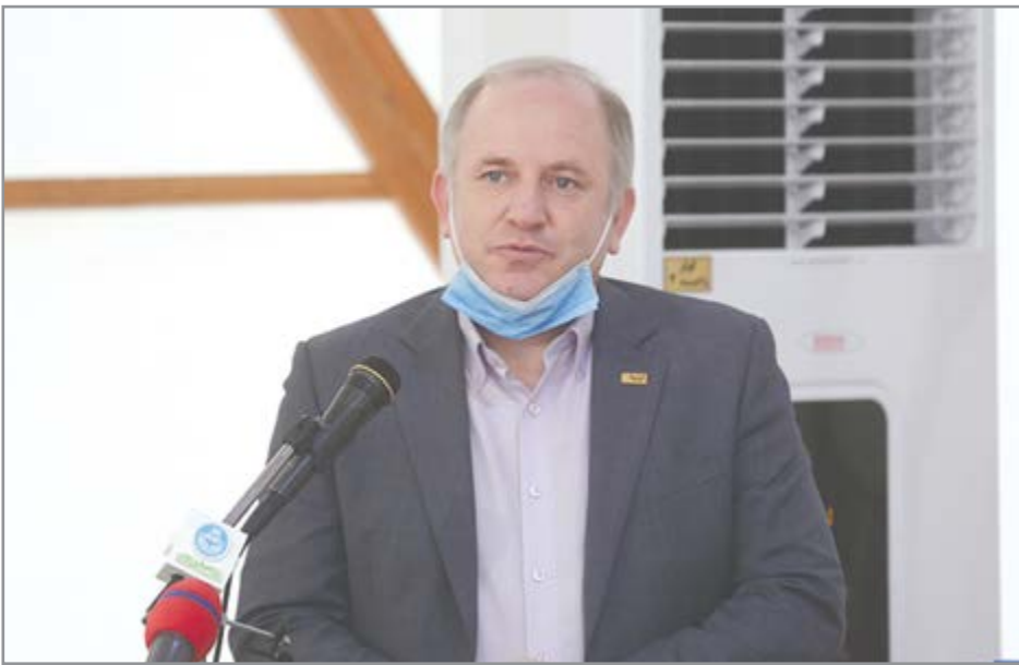
گروه صنعت گفت و گو

فولاد مبارک‌ر به‌عنوان پیلوت در کشور، مرکز اصلی مطالعه و پیاده‌سازی اقتصاد نسل چهارم می‌شود