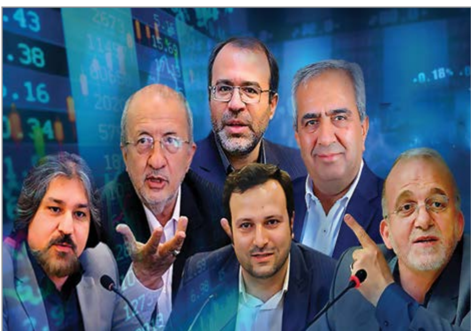
گروه شهری هفته نامه نوسان

نمایشگاه بین‌المللی اصفهان نمونه موفق از هم‌افزایی اتاق بازرگانی و مدیریت شهری اصفهان است