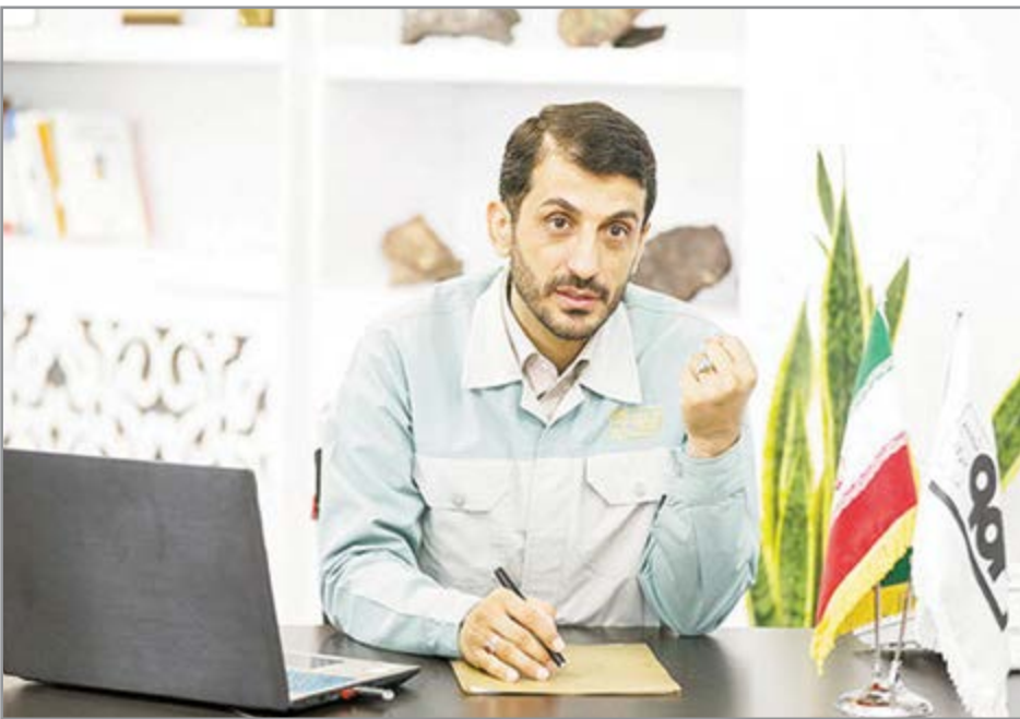
گروه صنعت هفته نامه نوسان

طیب نیا: از تهدیدها و محدودیت‌های موجود در حوزه صنعت، فرصت‌های طلایی بسازیم