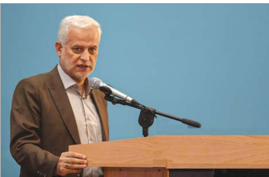
گروه بازارها هفته نامه نوسان

وی با تأکید بر همگرایی اظهار کرد: همگرایی خوبی بین شهرداری، میراث فرهنگی و استانداری اصفهان و دیگر ارگان‌ها شکل گرفته و نمره این هم‌راهی به‌زودی برای شهروندان قابل مشاهده خواهد بود. چنانچه، در مدت هفته فرهنگی اصفهان، اماکن تاریخی متعلق به میراث فرهنگی و شهرداری اصفهان برخی به صورت رایگان و برخی به صورت نیمه‌پایا پذیرای گردشگران هنرمندان در سطح ملی و دغدغه‌های شهر اصفهان را معماری ارگ جهان‌نما اعلام کرد و افزود: قرار شد فراخوانی برای باز آفرینی معماری این ساختمان داشته باشیم که امیدواریم هنرمندان در سطح ملی و بین‌المللی کمک‌کننده معماری این ساختمان باشند که در هفتمه مرکزی شهر به حالت آزار دهنده‌ای باقی مانده است. باز آفرینی شود. در محل مدرسه چهارباغ افروز دین ساختمان کازا لحاظ معماری و هنری با ساختار فرهنگی این دیار همخوانی ندارد باز آفرینی و بازطراحی خواهد شد. شهردار اصفهان از برگزاری مسابقات برای عموم شهروندان اصفهان با محوریت شعار مدیریت شهری «اصفهان من، شهر زندگی» خبر داد و گفت: عده‌ای با گسترش این شایعه که «اصفهان شهر زندگی نیست و باید از اصفهان کوچ کرد»، تبلیغات مسموم علیه شهر می‌کنند و تبلیغ اینکه اصفهان جای زندگی نیست و باید خیرداد و گفت: عده‌ای با گسترش این شایعه که «اصفهان شهر زندگی نیست و باید از اصفهان کوچ کرد»، تبلیغات مسموم علیه شهر می‌کنند و تبلیغ اینکه اصفهان جای زندگی نیست و باید