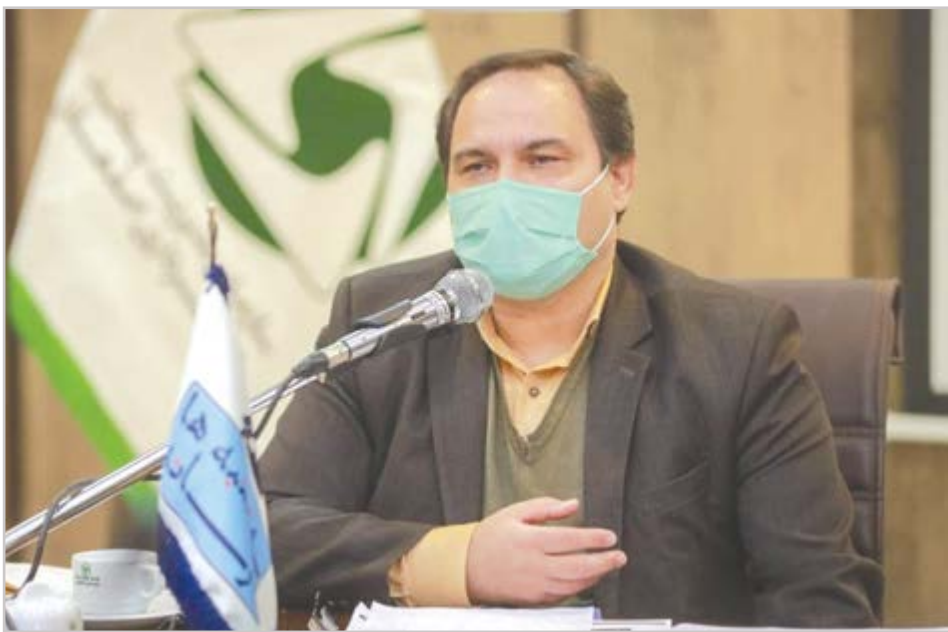
گروه شهری گزارش

دستگاه پایلوت هاضم بی هوازی برای نخستین بار در کشور راه اندازی شد