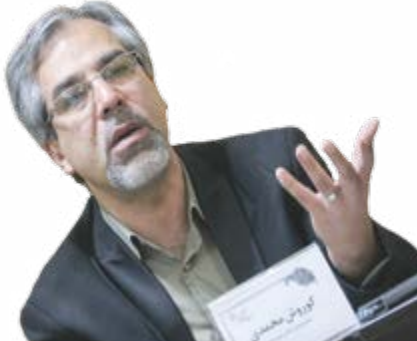
رادر مرحله اجرا تأثیر گذار کرده ایم.

شاخص کیفیت هوای اصفهان در بسیاری از روزها بالای ۱۵۰ رفته و گاه شاخص بالای ۲۰۰ را نیز شاهد هستیم؛ شرایطی که در هر کشوری اتفاق افتد با تعطیل شهر همراه خواهد شد زیرا رفت و آمد و تردد در این شرایط می تواند بسیار خطرناک باشد. وی با بیان اینکه وجود آلودگی هوا در اصفهان خطرات بدتر از کرونا را برای سلامت مردم رقم خواهد زد، تصریح کرد: اکنون با وجود شیوع کرونا، رفت و آمدها در شهر عادی بوده و همین موضوع می تواند خطرات جدی را برای