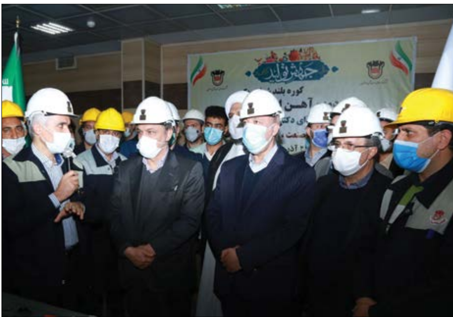
گروه صنعتی ذوب آهن

رزم حسینی: کمیته‌ای برای حل مشکلات صنعت فولاد تشکیل شده که قطعاً حامی ذوب آهن است