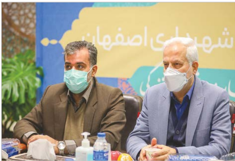
گروه شهری هفته نامه نوسان

سبک زندگی در محله‌های محروم شهر ارتقا می‌یابد