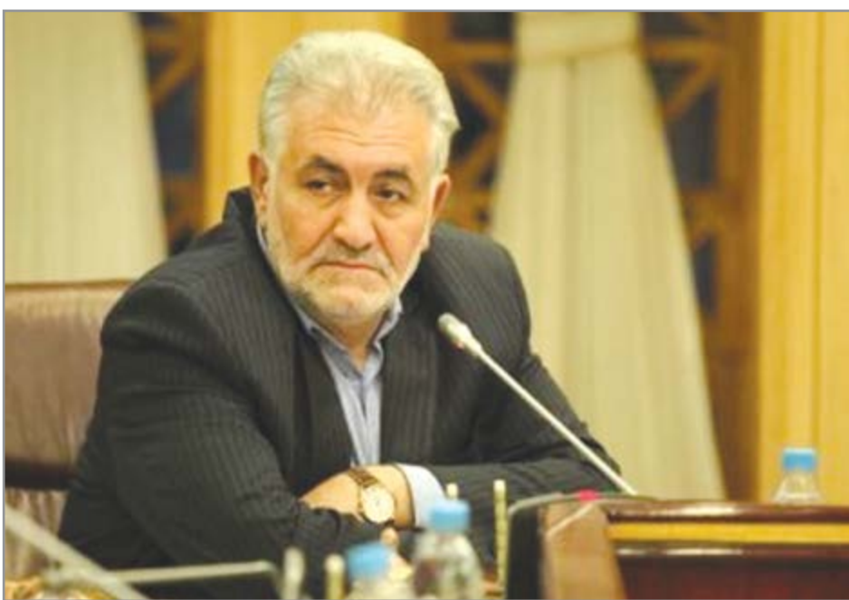
گروه صنعت هفته نامه نوسان

همکاری وزارت امور خارجه برای ورود افراد متخصص در کشورهای صنعتی ضرورت دارد