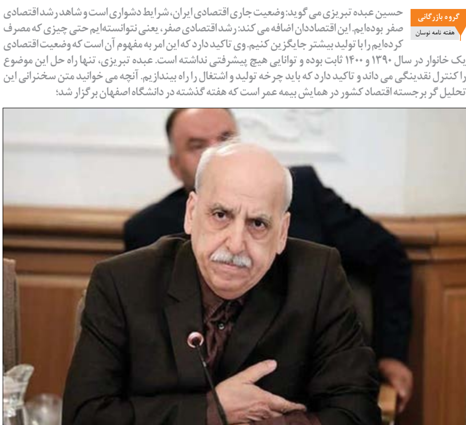
گروه بازرگانی هفته نامه نوسان

حسین عبده تبریزی می‌گوید، طی ۱۰ سال اخیر، هیچ رشد اقتصادی نداشته‌ایم