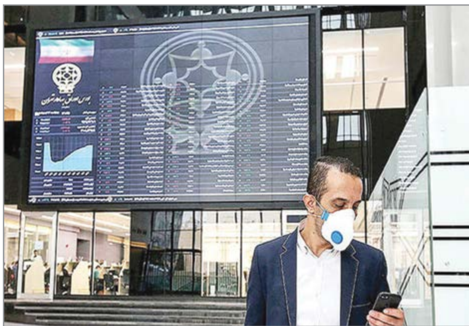
گروه بازرگانی هفته نامه نوسان

فعالان می گویند: دولت بازار را به مرگ می گیرد تا به تب راضی شود!