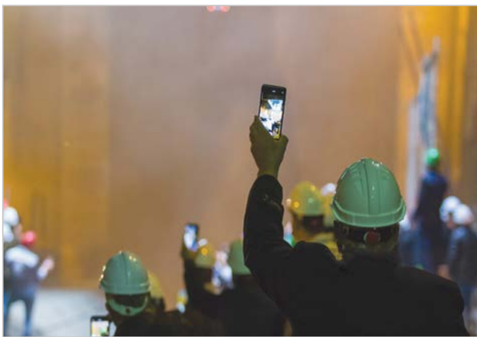
گروه شهری هفته نامه نوسان

از سال آینده کیفیت زندگی در محلات کم‌برخوردار ارتقا می‌یابد