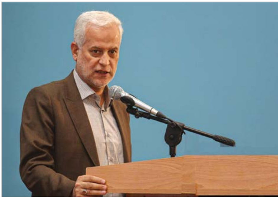
گروه شهری هفته نامه نوسان

باز نویسی برنامه پنج ساله شهرداری اصفهان کلید خورد