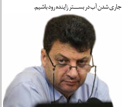
جاری شدن آب در بستر زاینده رود باسیم.

با بیان اینکه آب شرب مهمترین مسئله‌ای است که اکنون در حال پیگیری آن هستیم، افزود: تصفیه‌خانه باباشیخ علی که آب شرب اصفهان را تأمین می‌کند، ظرفیت لازم را برای پنج میلیون نفر بهره‌بردار از آب شرب ندارد. نایب رئیس شورای اسلامی شهر اصفهان اضافه کرد: پدیده فرونشست اینه تاریخی و ساختمان‌های مستکونی را مورد تهدید قرار داده و رسیدگی به این موضوع برای شورا اهمیت دارد لذا وظیفه داریم پیگیر