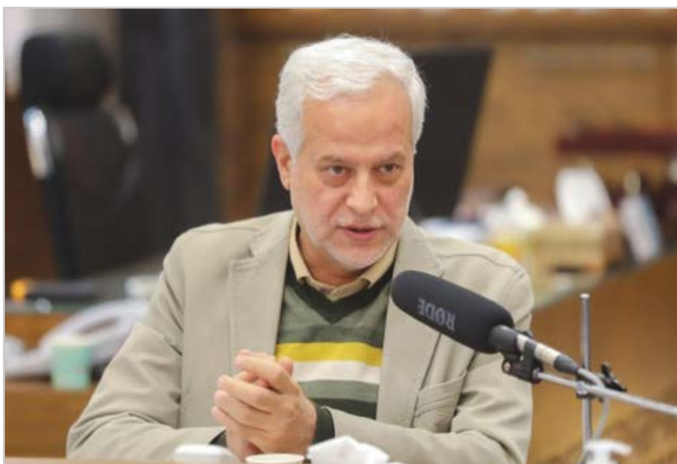
گروه شهری هفته نامه نوسان

شهردار اصفهان: محلات شهر اصفهان با هدف مناسب سازی برای سالمندان بازآفرینی می‌شود