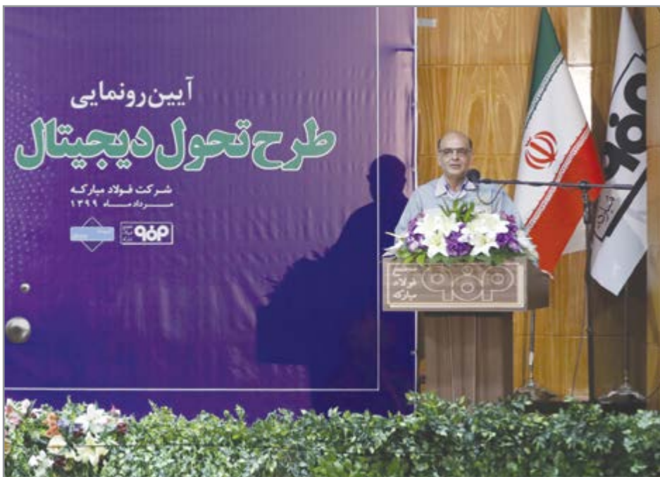
گروه صنعت گزارش

اجرای طرح تحول دیجیتال، ضامن آینده فولاد مبارکه در عرصه رقابت و تجارت جهانی است