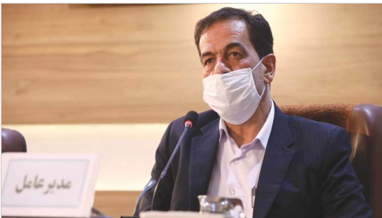
گروه صنعت گزارش

تقسیم ۴۰۰ ریال سود در مجمع عمومی عادی سالیانه صاحبان سهام شرکت پالایش نفت اصفهان