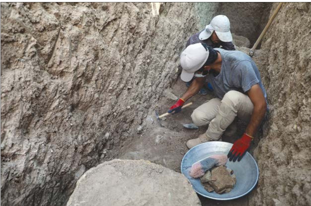
گروه شهری کزازی