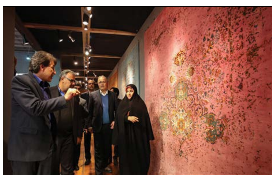
گروه بازرگانی نوری

نامور مطلق می گوید با ادامه روند فعلی باید فاتحه صنایع دستی و فرش دستباف را خواند!