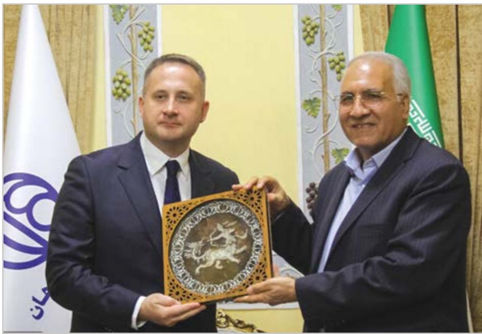
گروه شهری گزارش

لهستانی ها میهمانان ناخوانده ای بودند که در گیر و دار جنگ جهانی دوم وارد ایران شدند. در آن زمان هزاران تن از آوارگان لهستانی به شهر اصفهان انتقال داده شدند و نزدیک به سه سال در این شهر ساکن بودند. لهستانی های ساکن در اصفهان برای تأمین معاش، گرایش به شغل هایی مانند پرستاری، خیاطی، آشپزی و آموزش موسیقی داشتند. آنها با چرخ های خیاطی های خود یونینفرم ارتشی می دوختند و سبک خیاطی آن ها بر متد خیاطی ایران و اصفهان اثر گذاشت. همچنانکه تا مدت ها خیلی از جوانان اصفهانی موهای خود را به سبک لهستانی ها می تراشیدند! لهستانی ها درودگران ماهری بودند و در عین حال، قلم زنی روی مس و نقره، قالیبافی و منبت را از اصفهانی ها آموختند. حالا گفته می شود مردم لهستان علاقه ی زیادی برای سفر به اصفهان دارند هر چند که بسترهای توسعه گردشگری در این بخش مهیا نیست. این روزها بازخوانی خدمات متقابل ایران و لهستان در برهه جنگ جهانی دوم باب شده؛ دلپش هم آمدن سفیر لهستان به اصفهان و دیدارش با شهردار این شهر و البته طرح مسئله خواهرخواندگی اصفهان و کراکوف است تا بیوند این دو شهر را جاودانه سازد.