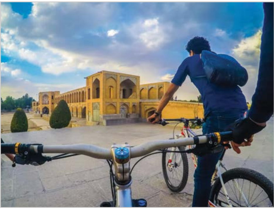
گروه شهری گزارش

یکپارچه کردن کارت‌های اعتباری مترو در سراسر کشور اقدامی ارزشمند برای توسعه بهره برداری از مترو است