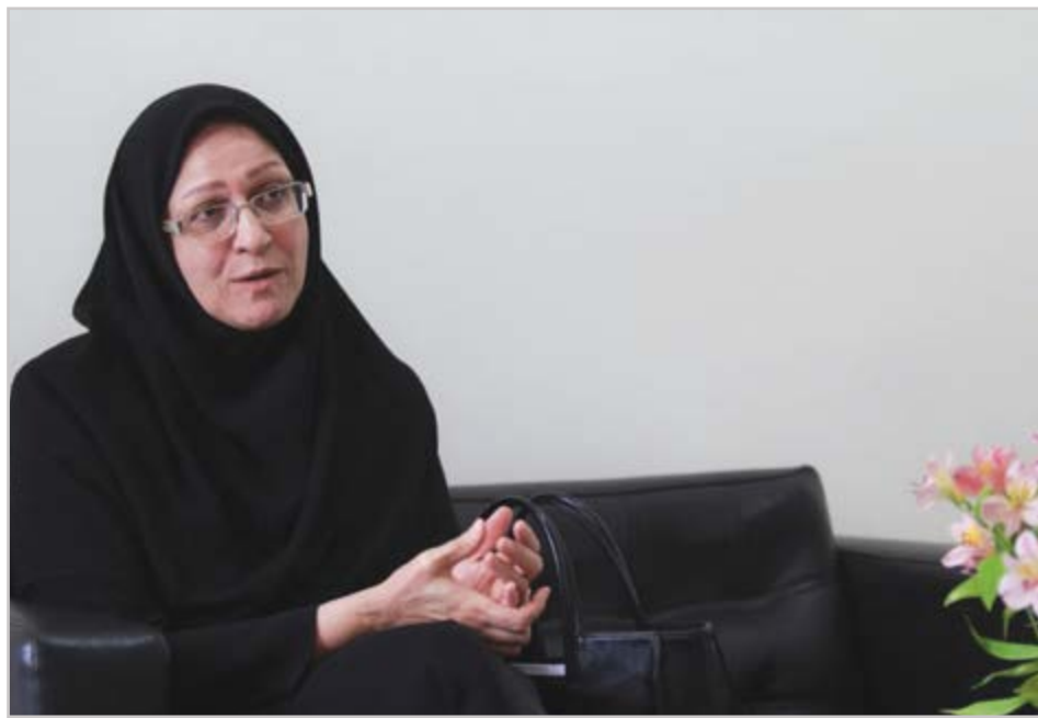
گروه شهری گزارش

برای توسعه فضای سبز شهر اصفهان، ۵۳ هکتار زمین تملک شد