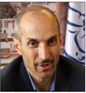
عباسی در دستور کار قرار گرفته است.

نوسان: مدیرعامل سازمان نوسازی و بهسازی شهرداری اصفهان گفت: در سال جاری با توجه به افزایش حدود سه برابری بودجه جهت اجرای پروژه های سازمان در راستای تحقق اهداف بازرگانی و تاریخی و گردشگری، اجرای پروژه هایی نظیر ساماندهی گذرهای منتهی به چهارباغ