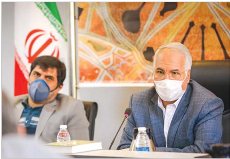
گروه شهری گزارش

نوروزی: استقرار یک نظم دقیق برای یک زندگی آرام در شهر، کار شهرداری است