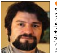
فریدون علیخواجه جامعه شناس

اختلال بدشکلی بدن (BDD) یا "خودزشت انگاری" وضعیتی است که فرد به شکلی وسواسی از قسمتی؛ یا تمام ظاهر خود ناراضی است و باعث بروز اختلال در روابط اجتماعی او می شود. قضاوت هایی که فرد درباره بدنش دارد و نیز قضاوت هایی که دیگران درباره بدن او دارند از جمله موارد مورد توجه برخی جامعه شناسان است. سوالهای مطرح در این سنخ مطالعات آن است که قضاوت ما در برابر بدنمان چگونه شکل می گیرد؟ چگونه برای بدن "استانداردسازی" می شود و رسانه ها در این فرایند چه نقشی دارند؟ طبق تحقیقات، "خودزشت انگاری"؛ در زنان بیشتر مشاهده می شود. آنان عموماً به دلیل "خوش اندام جلوه کردن" نگران وضع بدن خود هستند و به همین دلیل گرفتار رژیم های لاغری متعدد و روش های گوناگون مدیریت بدن می شوند تا مبادا چاق به نظر آیند و منزلت اجتماعی شان کاهش یابد.