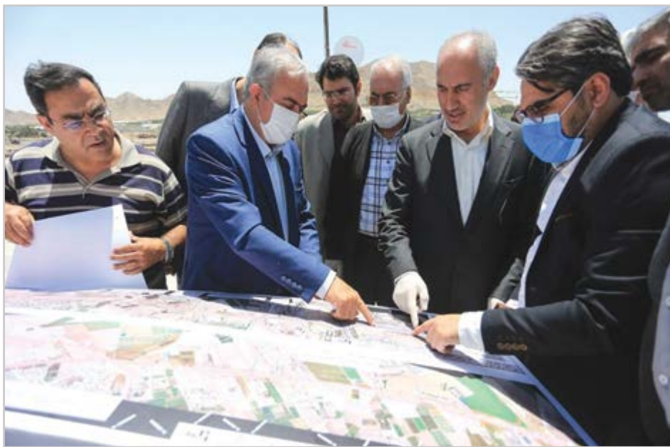
گروه شهری گزاش

پور محمدی: اصفهان با سرعت بسیار طرح های عمرانی را پیش می برد