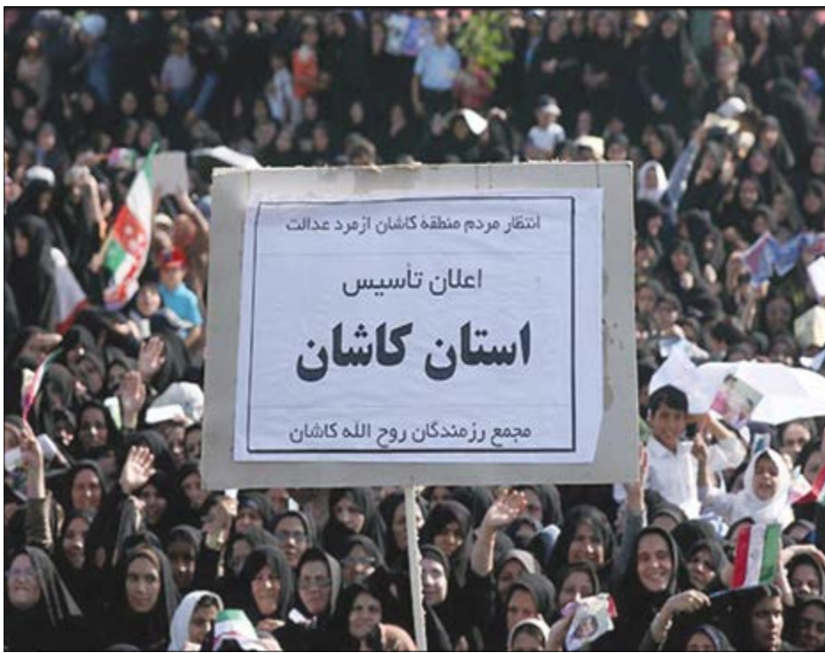
گروه شهری و کانونی

نعمت‌اله اکبری: چه ارزشیابی عملکردی از توفیق تفکیک استان خراسان وجود دارد که موافقان به آن استناد می‌کنند؟