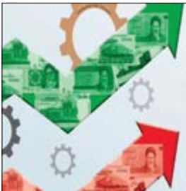
نوسان: بیش از نیمی از تولید ناخالص داخلی کشور، سهم پنج استان است: تهران، خوزستان، بوشهر، اصفهان و خراسان رضوی. از این رو، بزرگ‌ترین اقتصاد استان‌ها به ترتیب متعلق به استان‌های مذکور است. از آن سو، استان‌های سمنان، کردستان، چهارمحال و بختیاری و خراسان‌های شمالی و جنوبی، کوچک‌ترین اقتصادها در سال گذشته داشته‌اند.