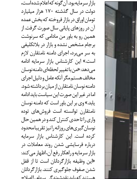
گروه بازارها بورس

در چهار روز کاری ایام نوروز، بیش از ۸۰۰ میلیارد تومان پول حقیقی از بازار خارج شد