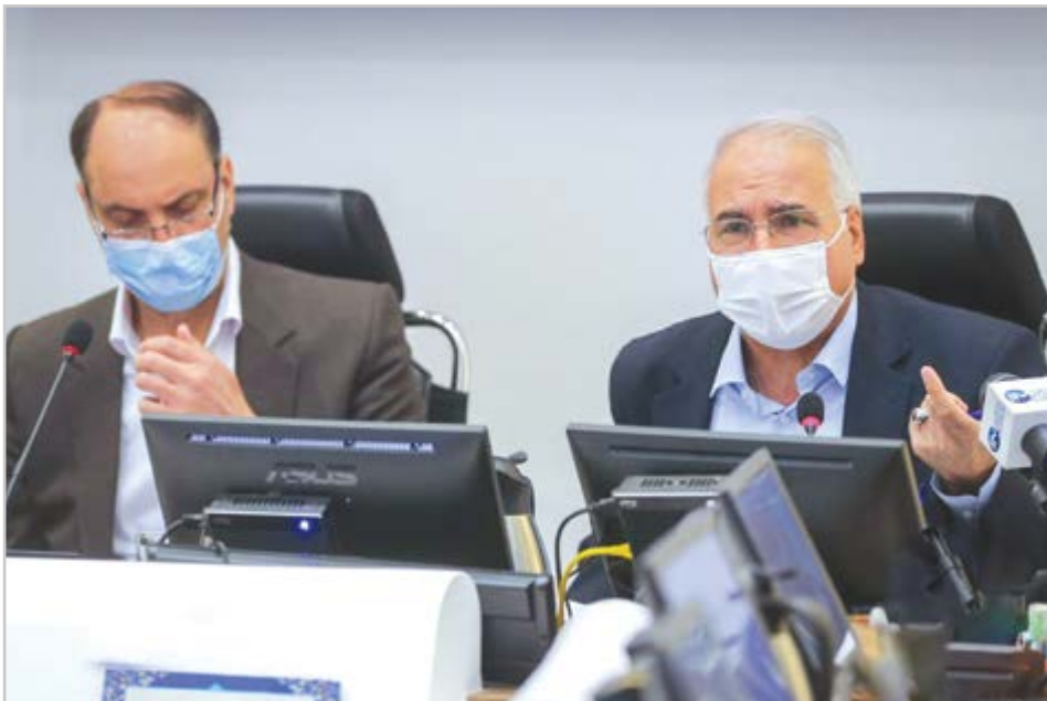
گروه شهری گزارشی

نوروزی: در چهار سال گذشته ۳۰۰ هکتار به فضای سبز شهر افزوده شده است