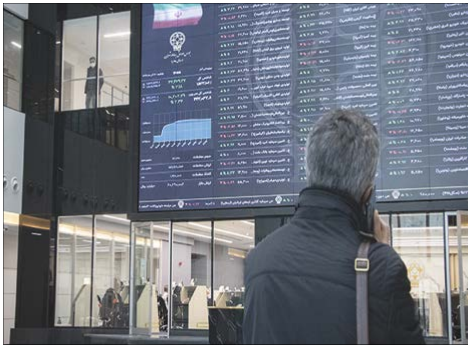
گروه بازارها بورس

در چهار روز کاری ایام نوروز، بیش از ۸۰۰ میلیارد تومان پول حقیقی از بازار خارج شد