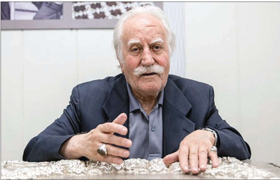
گروه شهری کوش

چرا "محمود فرشچیان" می‌گوید هنرستان هنرهای زیبای اصفهان، در حال از بین رفتن است؟