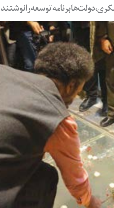
رئیس هیات مدیران گروه‌های تخصصی اقتصاد، گفت: در غیاب نخبگان فکری توسعه، دولت‌ها آمدند و برای خودشان برنامه توسعه نوشتند؛ هر دولت آرزوهای خود را به در برنامه های توسعه گنجانند؛ مصوب و منابع ملی را صرف آن کرد و حاصل این شد که ما هنوز داریم درجا می‌زیم.