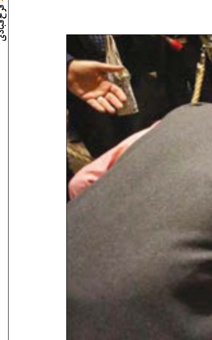
رئیس هیات مدیران گروه‌های تخصصی اقتصاد، گفت: در غیاب نخبگان فکری توسعه، دولت‌ها آمدند و برای خودشان برنامه توسعه نوشتند؛ هر دولت آرزوهای خود را به در برنامه های توسعه گنجانند؛ مصوب و منابع ملی را صرف آن کرد و حاصل این شد که ما هنوز داریم درجا می‌زیم.

یکی از دلایل اصلی این موضوع، نداشتن یک چارچوب مناسب برای سرمایه‌گذاران است. در حالی که در سایر کشورها، دولت‌ها با ارائه مزایای مالی و قانونی، سرمایه‌گذاری را تشویق می‌کنند.