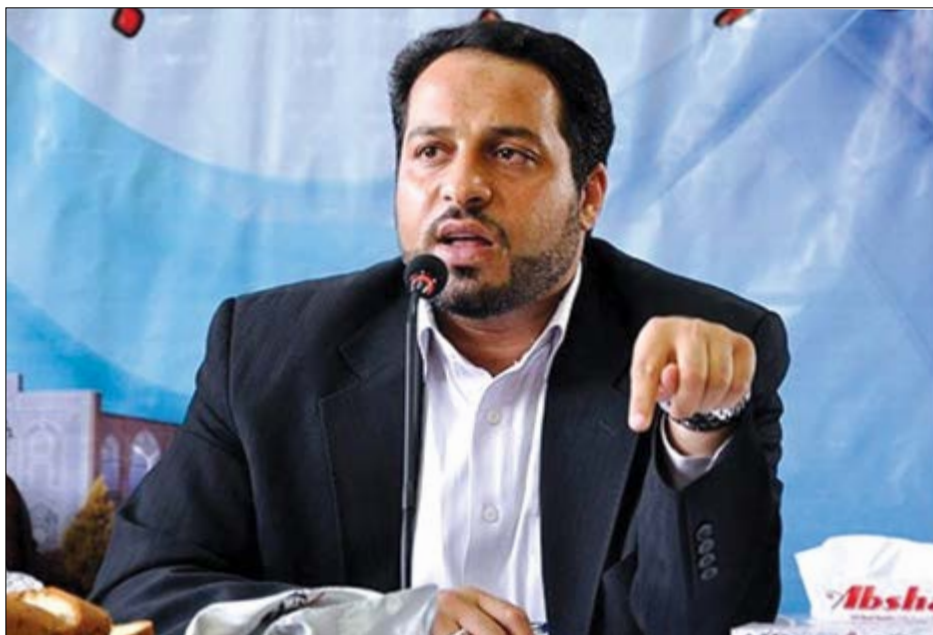
گروه شهری گزاش

سرعت اجرای شبکه فاضلاب با مشارکت بخش خصوصی ۱۴ برابر میانگین بیست و پنج سال گذشته بوده است