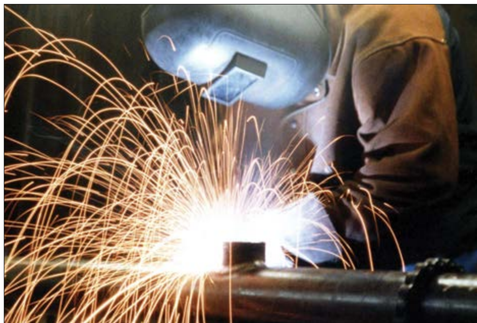
گروه صنعت گزارش

بررسی نحوه عملکرد اتاق بازرگانی در موضوع فولاد، شاخصی مهم برای عیارسنجی این نهاد اقتصادی است