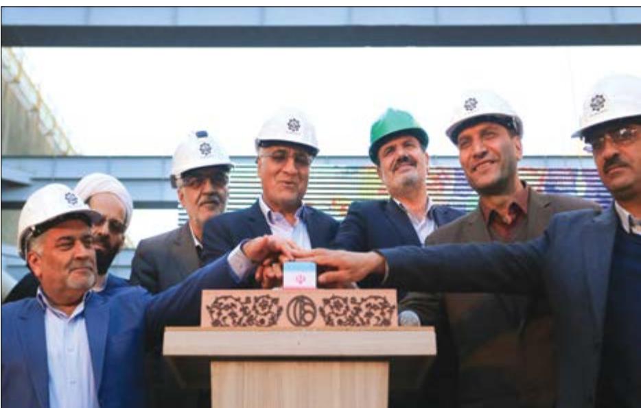
گروه شهری گزارش

خط دوم متروی اصفهان از زیر میدان امام(ره) عبور نمی‌کند