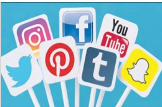
نویسنده: کان. Yixing Chen / Vamsi Kanuri

این روزها بسیاری از شرکت‌ها برای تبلیغات محصول یا خدمات خود فقط از یک روش استفاده نمی‌کنند. آنها برای آنکه از میدان رقابت حذف نشوند، چند روش را به کار می‌گیرند، از جمله بازار بازاریابی چاپی (مثل بروشورها، مجله‌های دوره‌ای و تراکت‌ها)، تبلیغات رادیویی و تلویزیونی، تبلیغات خیابانی (مثل بیلبوردها، پوسترها و تبلیغات روی بدنه اتوبوس‌ها)، تبلیغات پیامکی و بازار بازاریابی دیجیتال. بازار بازاریابی دیجیتال در حال حاضر به مهم‌ترین ابزار برای دسترسی به مشتریان تبدیل شده، چون بسیاری از مردم بخش اعظمی از زمان خود را در مقابل صفحه‌نمایش هلمی گذرانند.