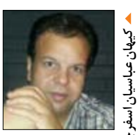
کجهان عباسیان اسفند چاچر

همیشه گفته‌ام همه آدم‌ها باهوش نیستند و در بین آدم‌ها همیشه با یک طیف پیوسته از هوش روبرو هستیم؛ آدم‌های باهوش هم مثل هم نیستند. آدم‌های باهوش را به سه دسته می‌توان تقسیم بندی کرد. آدم‌های باهوش شروع کننده این دسته آدم‌های باهوش شروع کننده‌های خوبی هستند ایده جدید می‌دهند. بنیانگذاران همیشه شروع کننده‌های خوبی هستند. اینها وقتی فکر می‌کنند نیاز به زمینه و پیشینه فکری ندارند. خلق کننده ایده هستند. اما برخی موارد به این مرحله بلوغ نمی‌رسند، چرا؟! به دلیل اینکه شروع کننده خوب لزوماً توسعه دهنده خوب نیست. نمی‌داند که یک بنگاه اقتصادی در طول دوره حیات خود مراحل مختلفی دارد نیازهای متنوع دارد. که بنیانگذار آن از درک آن عاجز است. بنابراین تله بنیانگذار را می‌توان عدم شناخت نیاز سیستم در مراحل مختلف رشد توسط بنیانگذار آن است که باعث می‌شود هیچگاه توسعه و تکثیر را تجربه نکند. کسب و کارهایی که در طول زمان همان که بوده‌اند می‌مانند یا نابود می‌شوند ممکن است در تله بنیانگذار گرفتار شده باشند. باید یک جانی مالکیت و مدیریت را از هم تفکیک کنیم تا دچار این خود زنی نشویم.