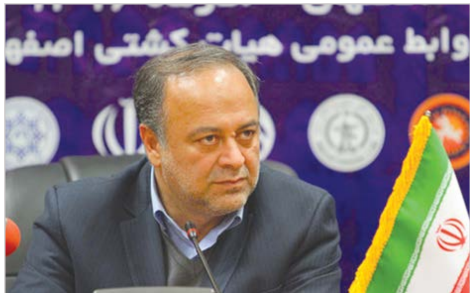
گروه شهری گفت و گو

به ازای هر ۲۶ نفر یک واحد صنفی خرده‌فروشی در اصفهان وجود دارد!