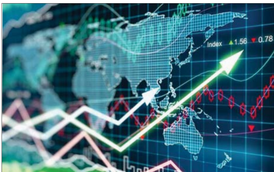
گروه صنعت گزاشی

بررسی های نشان می دهد که شرایط مناسب تولید و صادرات در سه صنعت، تا پایان سال تداوم خواهد داشت