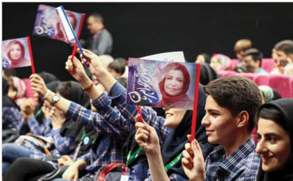
گروه شهری کوزش

۱۷۳۴ پروژه به مناسبت هفته دولت در سطح استان اصفهان افتتاح می شود