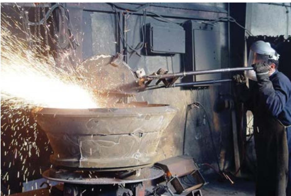
گروه صنعت گزارش

در ۲ سال گذشته، الکترو د گرافیتی مشکل بزرگی برای فولادسازان ایجاد کرد