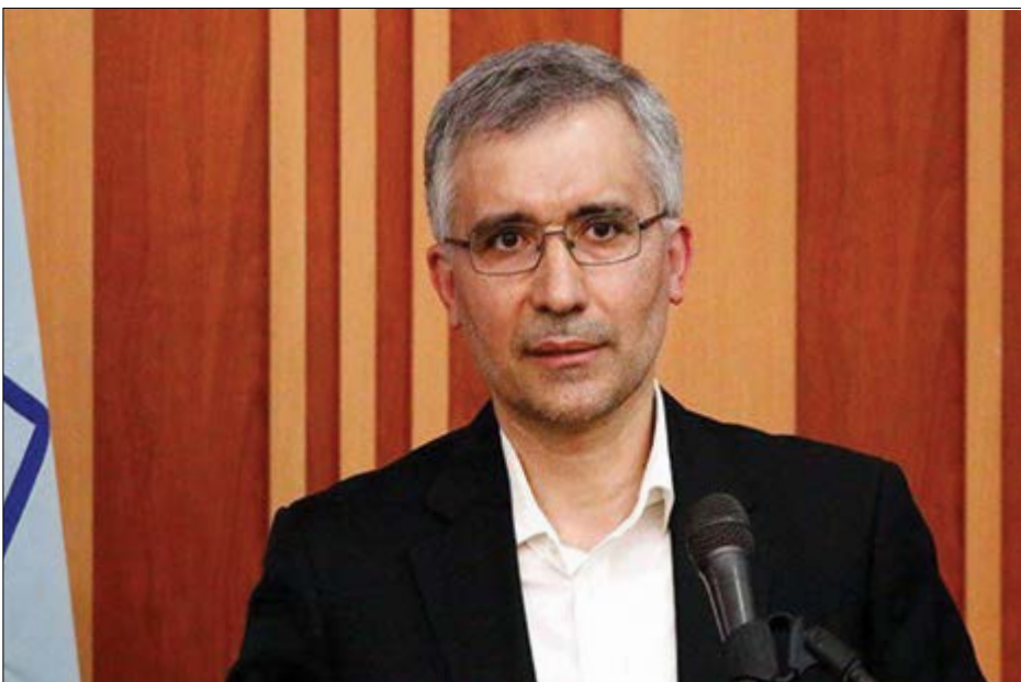
گروه صنعتی گفت و گو

ذوب آهن همواره بیشتر از تولید محصولات متنوع ساختمانی و صنعتی است