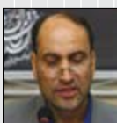
گروه شهری گزارش

رئیس شورای اسلامی شهر اصفهان گفت: منطقه ۱۴ امروز تبدیل به یک کارگاه بزرگ عمرانی و به یک میدان فرهنگی، ورزشی و هنری که حق مردم منطقه بوده تبدیل شده است. علیرضا نصر تصریح کرد: خوشبختانه خط دو قطار شهری اصفهان از منطقه زینبیه آغاز شده و نویدبخش ارزش افزوده در این منطقه است. وی با تاکید بر نگاه ویژه مدیریت شهری اصفهان به مناطق کمتر برخوردار گفت: با تحولات عمرانی ایجاد شده در منطقه ۱۴، زمینه برای سرمایه گذاری بخش خصوصی فراهم شده است.