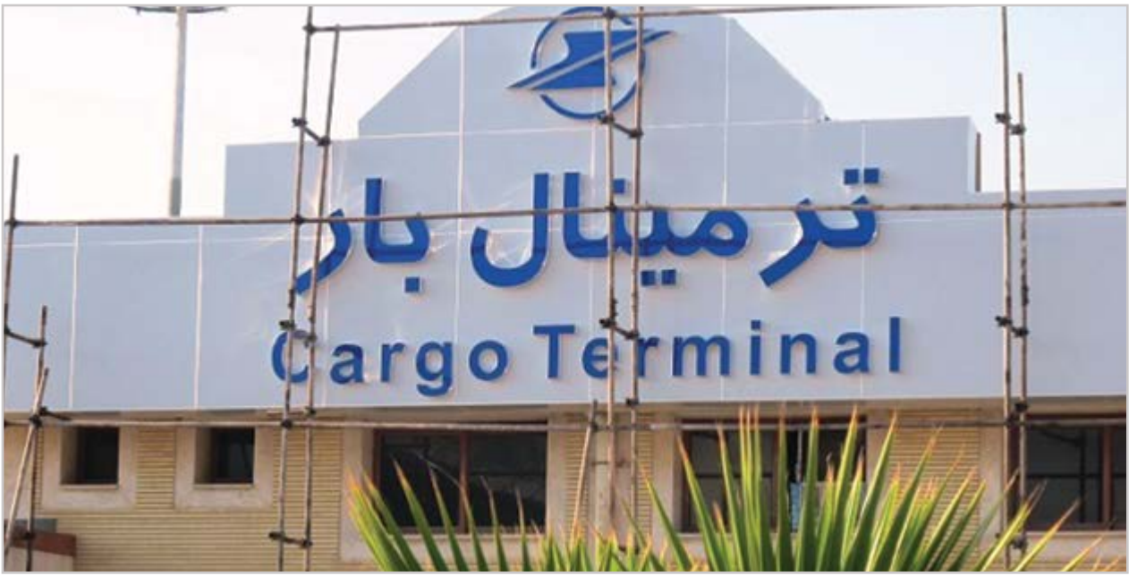
گروه شهری گزاش

دزفولی: کارگو ترمینال اصفهان برای بهره برداری به زنجیره تامین نیاز دارد