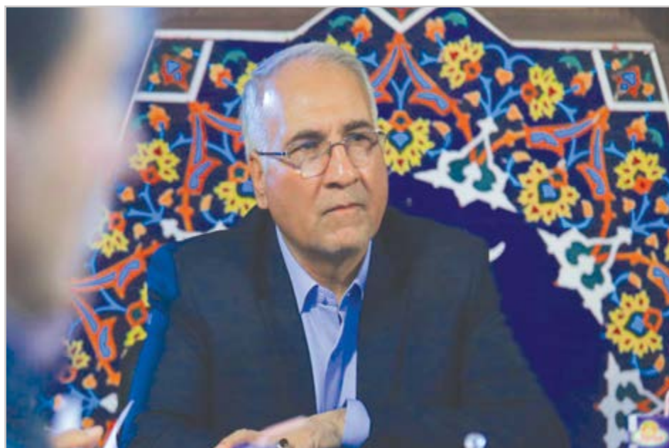
گروه شهری گزارش

شورا و شهرداری بر عملکرد مدیران مناطق در استفاده از انرژی خورشیدی نظارت می کنند